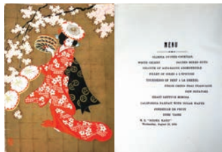
浅間丸のメニュー 船の科学館蔵

日本では第一次世界大戦後の大型客船建造ブームを経て、昭和4年に豪華客船の時代が始まりました。ポスターやメニュー、記念品などから、豪華客船の旅を紹介します。