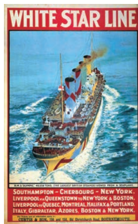
「WHITE STAR LINE「OLYMPIC」」ポスター 船の科学館蔵