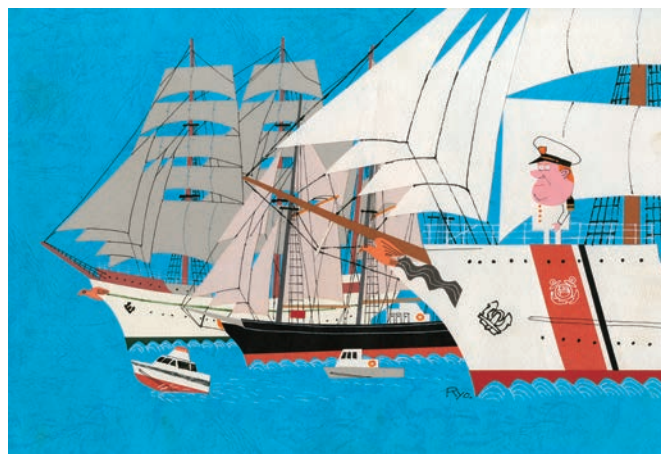
アメリカ建国200年記念大航海レース 切り絵

船や港、そしてトリス君のイラストレーターとして知られた柳原良平(1931~2015)氏の回顧展です。柳原氏のイラストは濃度の違う紙、あるいは色紙を切って制作する独特の方法でした。柳原夫人から横浜市に寄贈された数千点の作品の中からイラストレーターとしての柳原良平氏の世界を紹介していきます。