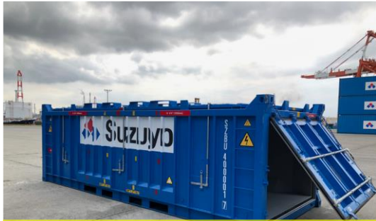
天面、後面が開口部